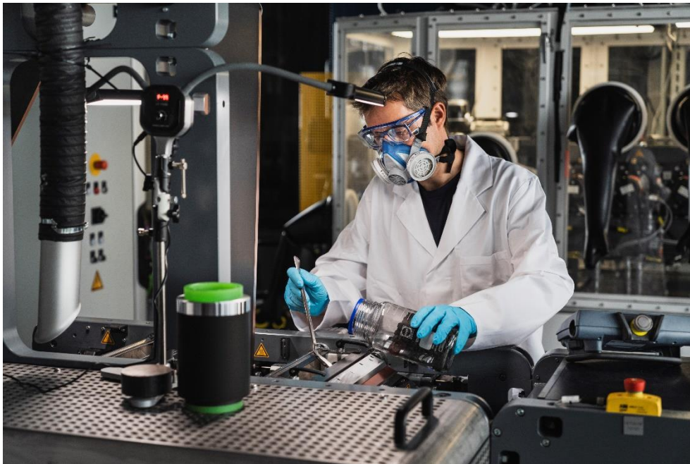
Das trockene Ausgangsmaterialgemisch wird in den Kalenderspalt der DRYtraec®-Anlage gegeben.

Weitere Informationen zu DRYtraec® finden Sie in diesem Video .